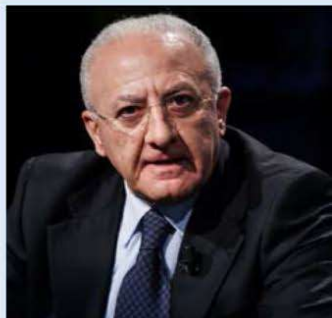
Vincenzo De Luca (Governatore Regione Campania)

Un progetto attesissimo, sognato per 25 anni e che è stato fortemente voluto e appoggiato dalla Regione Campania. “Il Museo è uno dei punti di forza del rilancio turistico culturale della nostra regione - ha affermato il governatore della Regione Campania Vincenzo De Luca -. Siamo custodi di cose uniche al mondo. Certo, questa è una zona complessa non nascondiamolo, e lo sviluppo turistico è quello più difficile da realizzare. È un comparto economico che richiede efficienza ed efficacia in più settori, dalla mobilità alla sicurezza, dalla tutela dell’ambiente a quella del sistema sanitario. Ecco perché non rallenteremo, continuando su questa strada”.